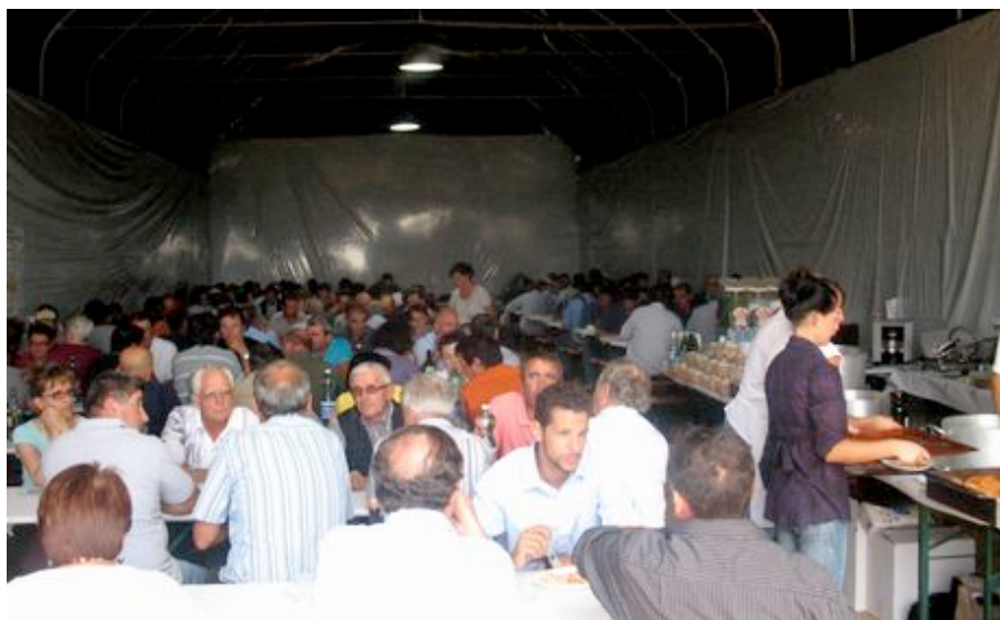
Pranzo con gli invitati.

La Dal Pane Vivai , in collaborazione con il Consorzio Kiwigold e la Summerfruit , hanno organizzato, da giovedì 24 a sabato 26 settembre 2009, una tre giorni con i più importanti produttori di actinidia sia italiani che esteri . La partecipazione ha superato le 400 unità, risultato estremamente importante, visto che buona parte dei presenti hanno viaggiato per più di 1000 km, per non mancare all'evento.