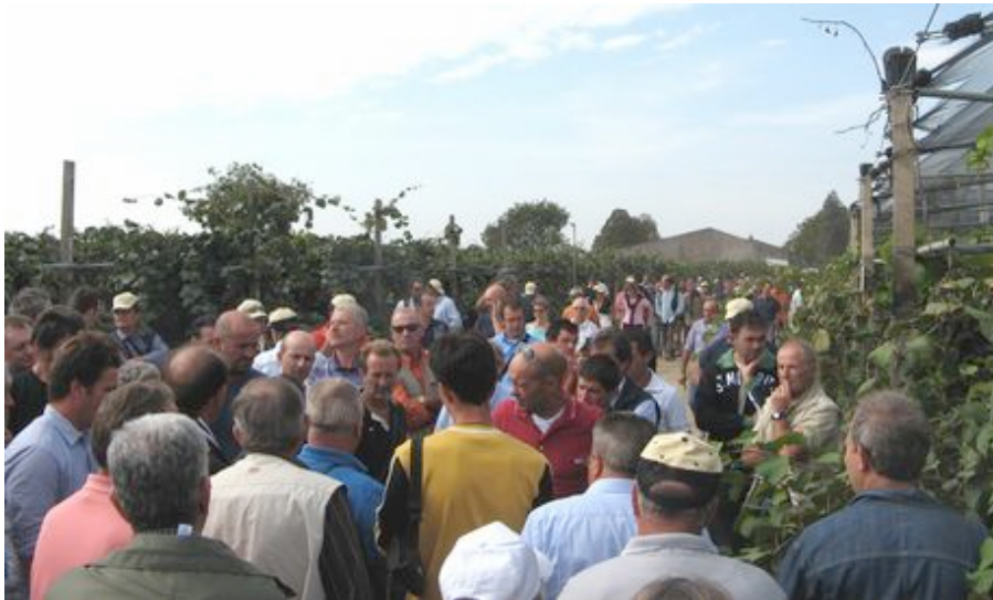
Visita agli impianti di kiwi.

Le giornate si sono svolte nell'azienda di Zevio (VR) , una delle tre sedi dove la Dal Pane svolge l'attività vivaistica su 18 ettari, con la produzione di piante di Hayward, Jintao e Summer 3373. Su altri 10 ettari sono coltivate e già in produzione le varietà Summer 3373 e Jintao. La Dal Pane Vivai detiene i diritti in esclusiva della produzione delle piante.